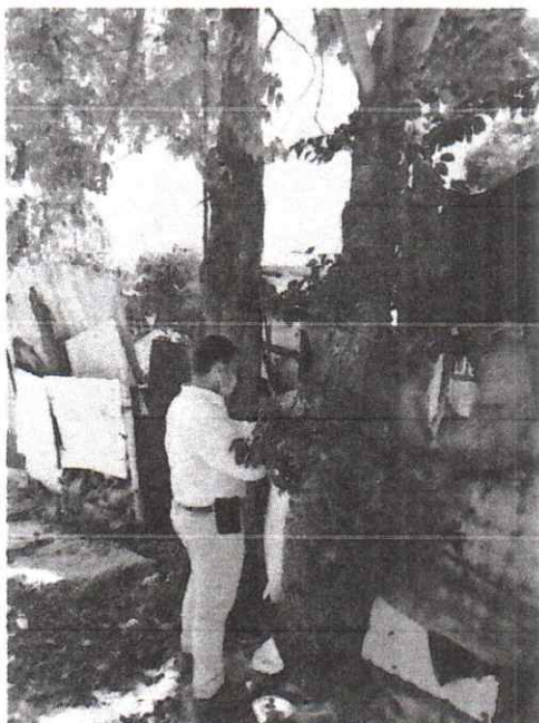
Foto 3. Los Tulipanes africanos creciendo tanto dentro de propiedad privada como la vía pública.