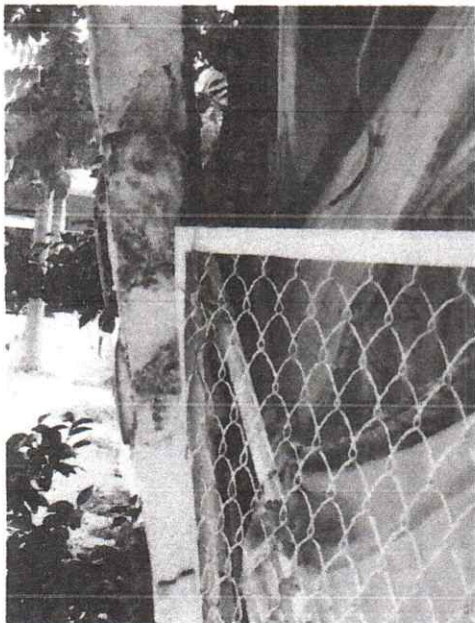
Foto 1. Vista lateral del daño que han provocado los árboles a la mufa de una vivienda.