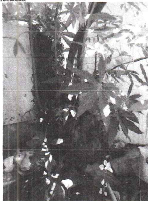
Foto 4. Rebrote de la Ceiba ubicada dentro del domicilio y a escasos centímetros de la orilla de la calle.