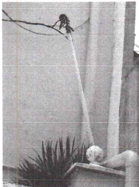
Foto 2. Se puede apreciar que debido al peso que las ramas ejercen sobre el cableado, las instalaciones eléctricas se han visto afectadas.